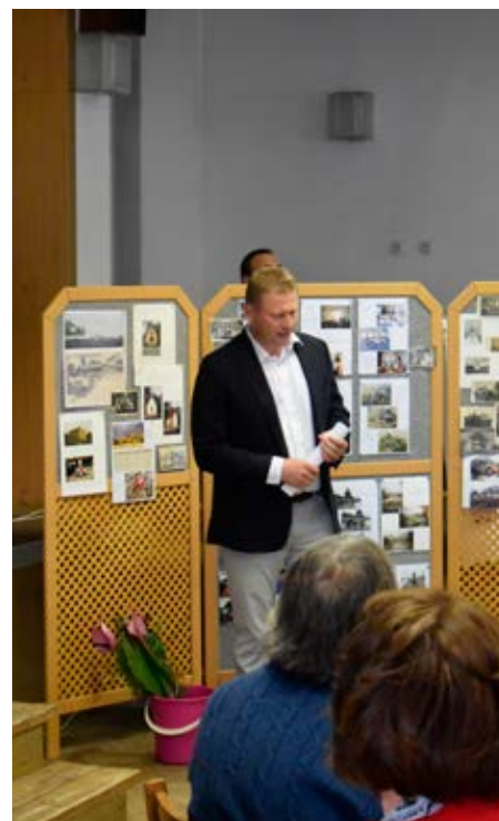
Další fotky ze Setkání naleznete na zadní obálce.